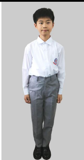
男生：免熨的確涼白紡校恤 灰紡毛斜紋絨校褲