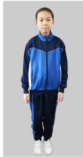
男女生：冬季健康布運動套裝（外尼龍，內全棉）