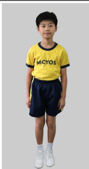
男女生：夏季全棉的確涼紡運動服