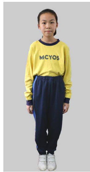
男女生：棉質長袖運動衫 健康布運動長褲