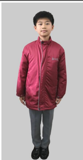
男女生：棗紅色絹面棉襖／棗紅色絹面棉襖連抓毛背心