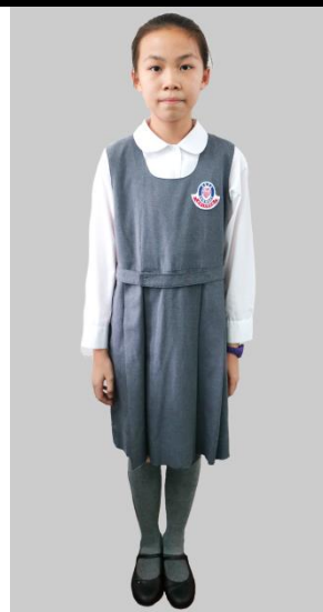
女生：免熨的確涼白紡校恤 灰紡毛斜紋絨校裙