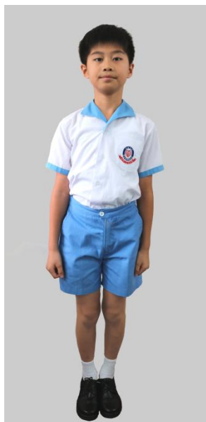
男生：免熨的確涼白紡校恤及淺藍紡校褲