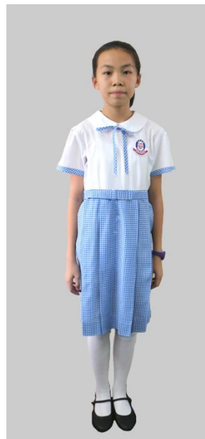
女生：免熨的確涼淺藍格紡校裙