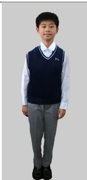
男女生：深藍色淺藍邊背心／深藍色長袖外套